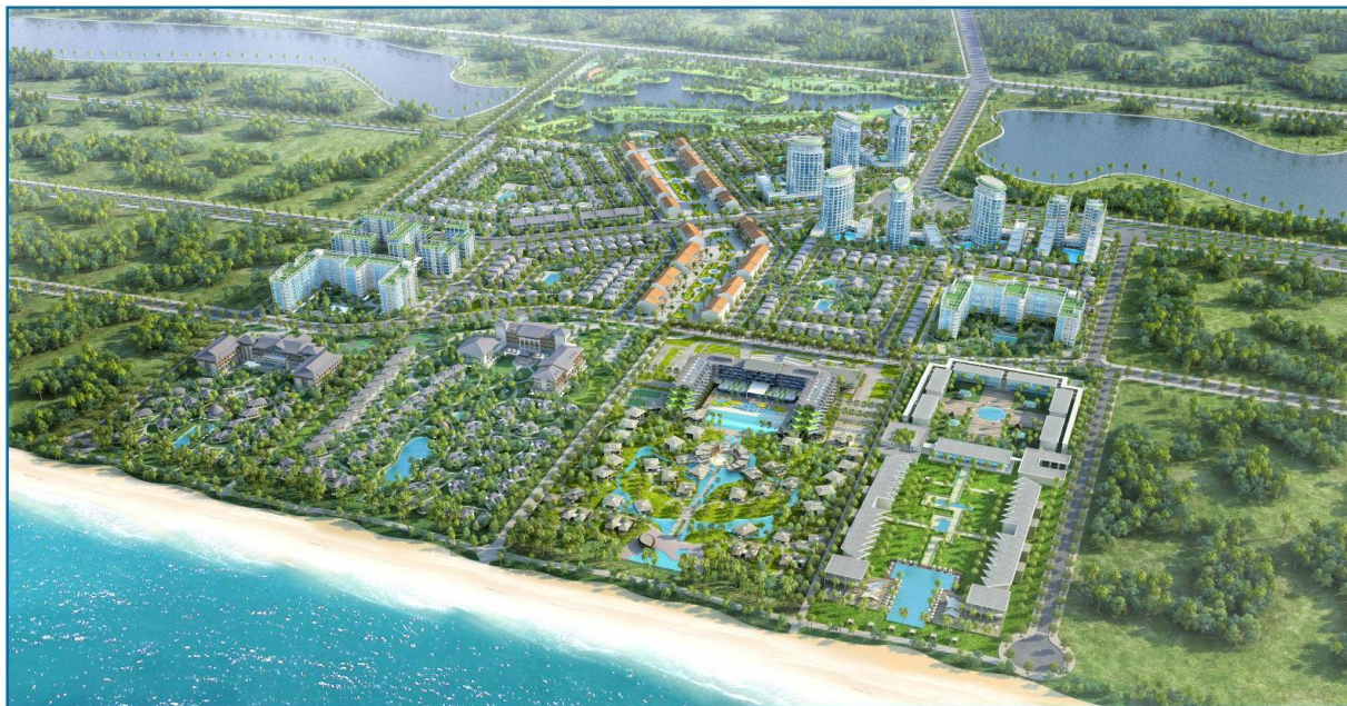
(Hình ảnh khách sạn DTC của Công ty Cổ phần Đầu tư Đức Trung nằm trong Tổng thể dự án Sonasea Villas&Resort)

Với vị trí đặc địa nằm trọn vẹn trong khu nghỉ dưỡng Sonasea Villas & Resort 130 ha, khách sạn do công ty CP-ĐT Đức Trung có thuận lợi là thụ hưởng các tiện ích cao cấp trong khu resort như: